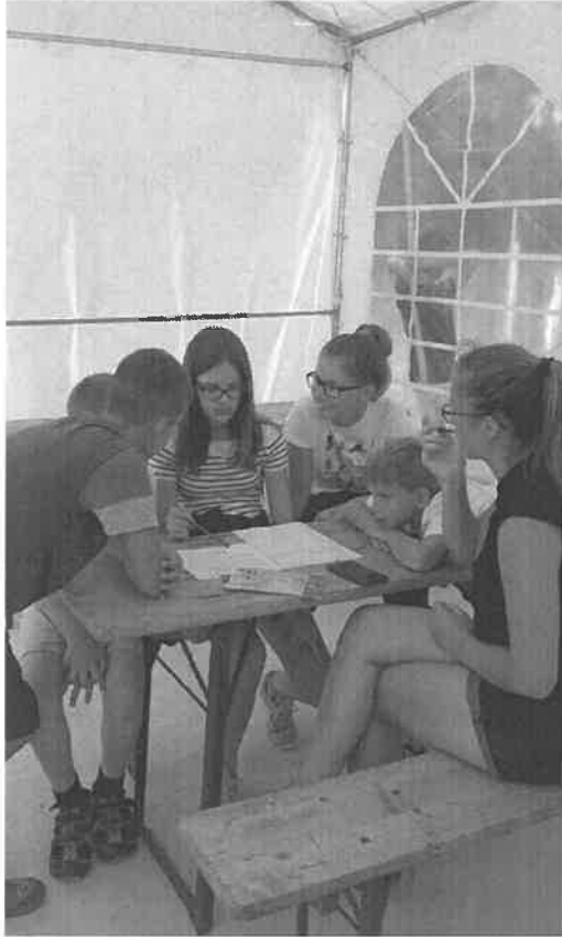
Csoportfoglalkozás a „kiképzőtisztekkel